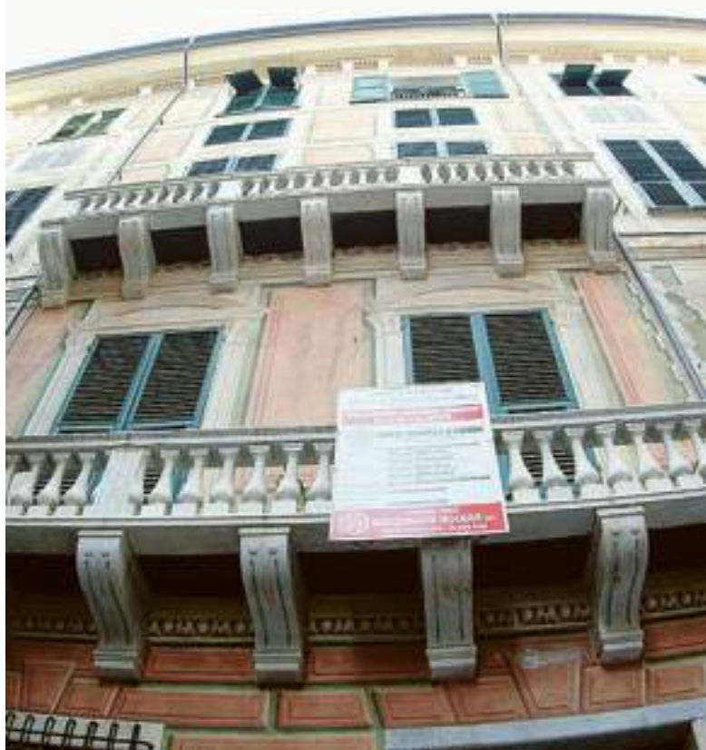
La facciata del palazzo di via Ravaschieri, a Chiavari, sede dell'Economica

badinelli@ilsecoloxix.it © RIPRODUZIONE RISERVATA