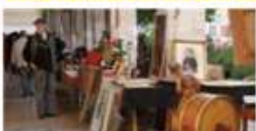
Recco Antiqua mercatino dell'antico