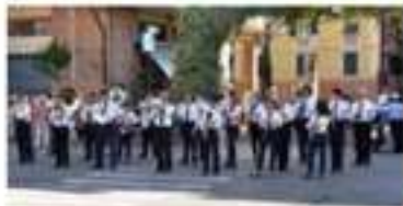
Filarmonica Rossini musica itinerante