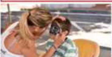
Area Bimbi Giochi e truccabimbi