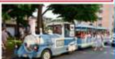
Il trenino della Festa dedicato ai bambini