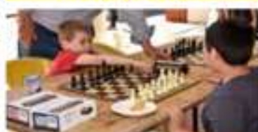
Chess & Cheese scacchi in piazza