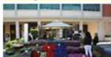
Helianthus & made in Recco