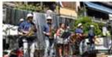
Orchestra Primavera con ballo