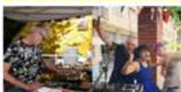
DJ Set e intrattenimento con musica dal vivo