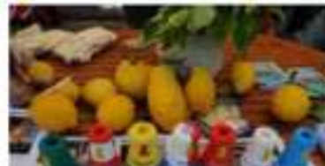
Comitato dei Quartieri Sagra del Fuoco