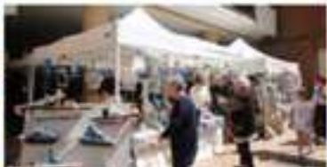
Cose faete da mi - Home w. mercatini hobbisti